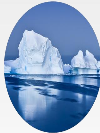
Klima- og energiomstilling